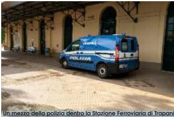
Un mezzo della polizia dentro la Stazione Ferroviaria di Trapani

La stazione ferroviaria di Trapani ieri mattina è rimasta chiusa al pubblico per quasi tre ore a causa di un allarme bomba. Sono immediatamente scattati i protocolli di sicurezza e la Questura, attivata dalla Polfer che per prima ha raccolto la segnalazione di un dipendente di Trenitalia, ha fatto intervenire gli artificieri. Il presunto ordigno è stato individuato da un addetto alle pulizie in una valigetta abbandonata sotto un sedile di una carrozza del convoglio delle 7.55 proveniente da Castelvetrano. Un treno che di solito viaggia con a bordo studenti e pendolari. Come poi risulterà s'è trattato di un bagaglio dimenticato da qualcuno, ma sul momento è stata presa la decisione di non sottovalutare la segnalazione e di procedere come da protocollo. A partire dalle 10.30