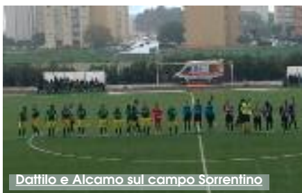
Dattilo e Alcamo sul campo Sorrentino