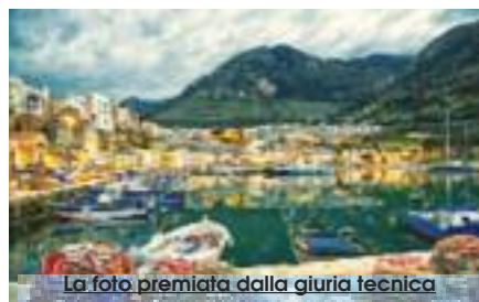
La foto premiata dalla giuria tecnica

Gli autori delle tre foto riceveranno in premio rispettivamente una fotocamera Sony RX100 V,